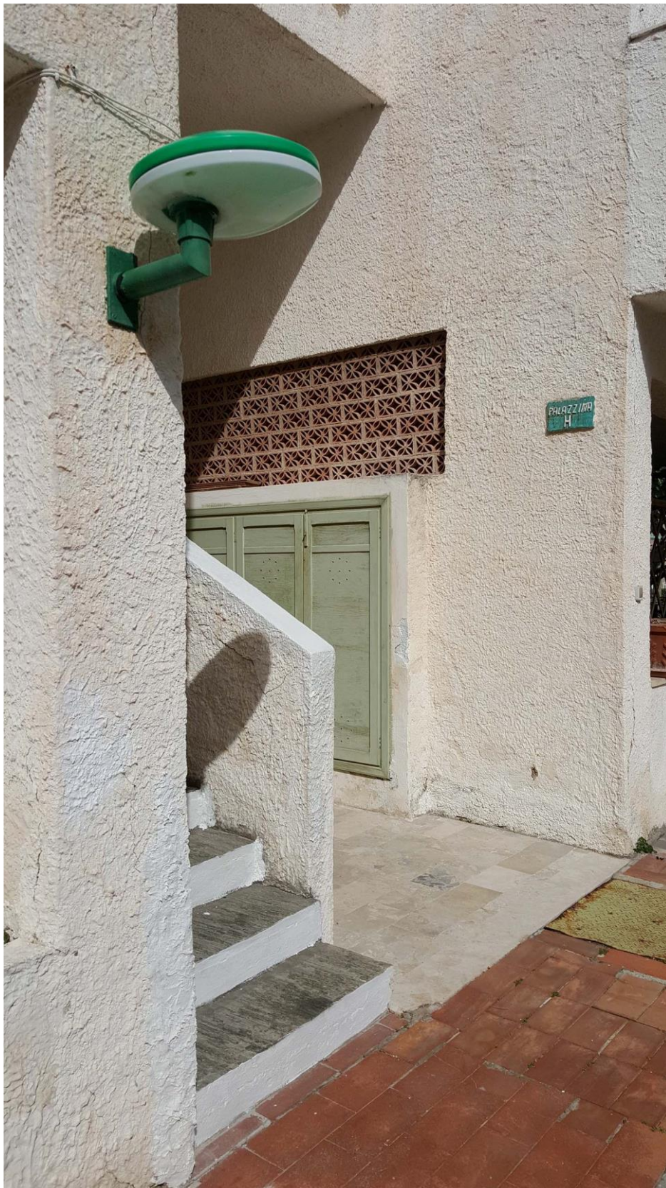
La Terrazza di Tito: Entrata da Palazzina H. Salire le scale fino in cima