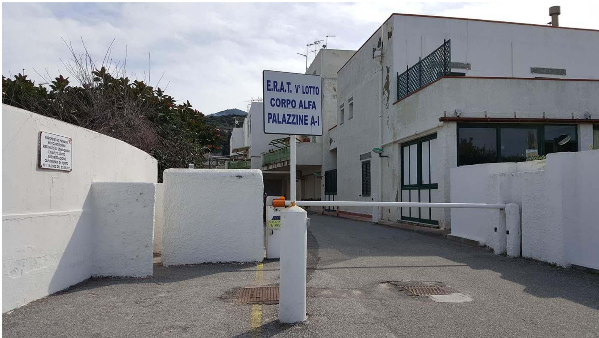
La Terrazza di Tito: entrata al complesso dal lungomare di Rodia